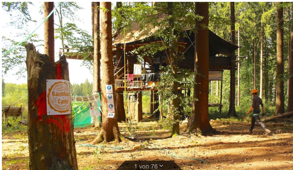
Geschafft – das Baumhauscamp im Klafferwald ist fertig!

Region > Neckarsteinach: Fotos: Baumhauscamp des CVJM ist fertig